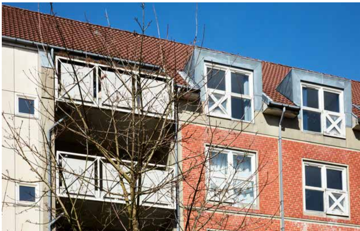
Boligafdelingen Prags Boulevard på Amager.