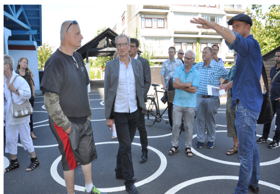
DOMUS, Det Fælles Byggeudvalg og Teknik- og Milljøudvalget på rundtur i Brøndby Strand

Her på siden er vist billeder fra hele forløbet frem til afstemningerne om designmanualen.