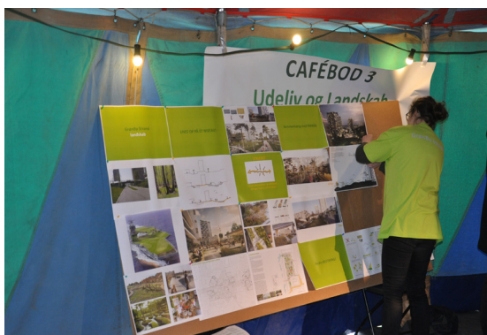
Team DOMUS forbereder udstilling til teltarrangement

Nu er den her - 851 sider lang alt i alt og delt i tre. Principerne i designmanualen er godkendt af kommunalbestyrelsen, så den er snart klar til at danne grundlag for den kommende renovering.