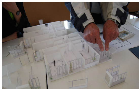
Altanløsninger bliver diskuteret på Åben Tegnestue