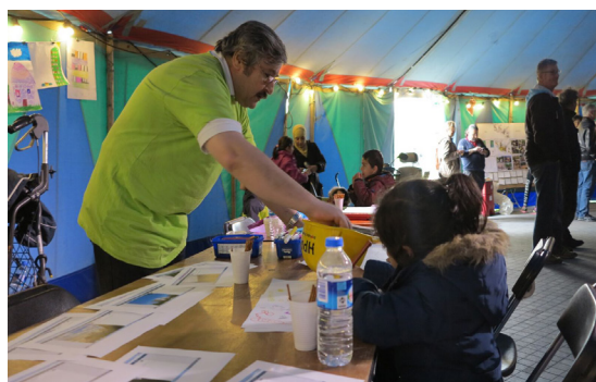
Børnenes Rejsebureau underholder til teltarrangement