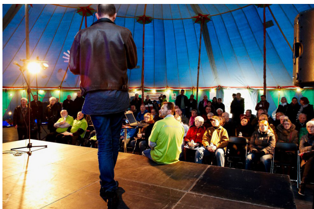
Åbent telt d. 28. marts

Efter arrangementerne har arkitekterne arbejdet videre med fx udendørsarealerne og flere forskellige altanløsninger. På de orienterende beboermøder vil arkitekterne vise de alternative løsninger samt resten af indholdet i designmanualen.