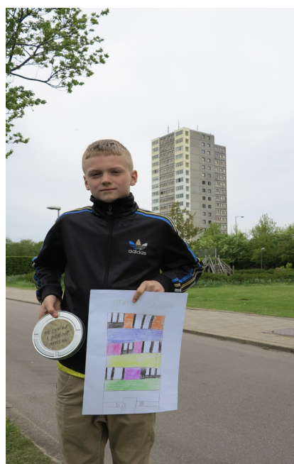
En af vinderne i tegnekonkurrencen